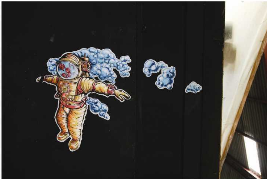
Laisse toi porter