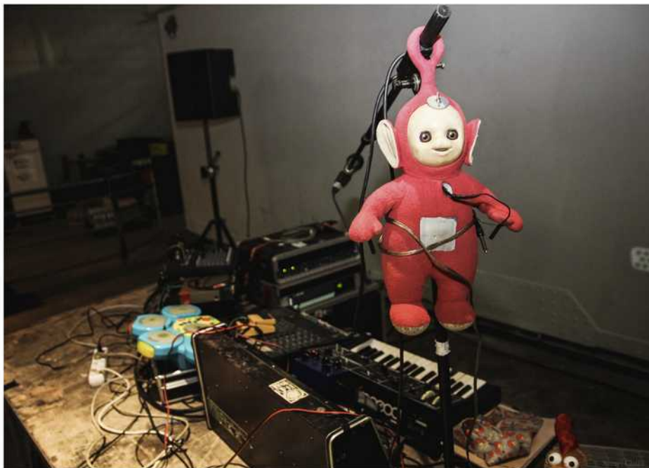
Nous aussi on n'est pas rassuré