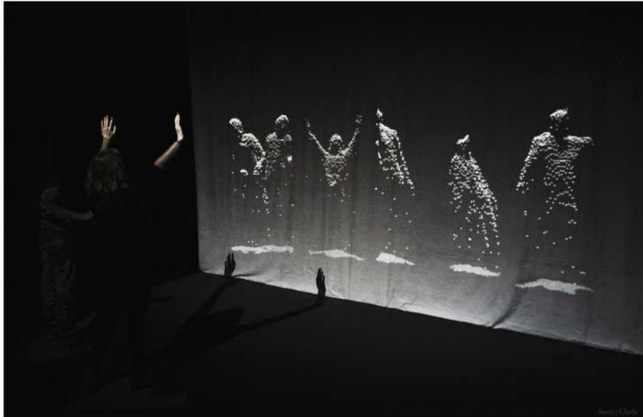
Une pluie de lumière

Pour sa septième édition, le THSF a choisi pour thème la temporalité : à l'heure où l'état d'urgence, des révélations inattendues ou des lois douteuses ébranlent les fondamentaux de notre société, l'alternatif et l'indépendant, réels contre-pouvoirs, n'ont jamais autant eu besoin de durer et de se transmettre dans l'espace et dans le temps. C'est leur idée, et ils vous invitent à venir voir et entendre ce que donne la fusion de l'artiste et du hacker dans ces 4000 m 2 situés à 15 min du métro Canal Du Midi.