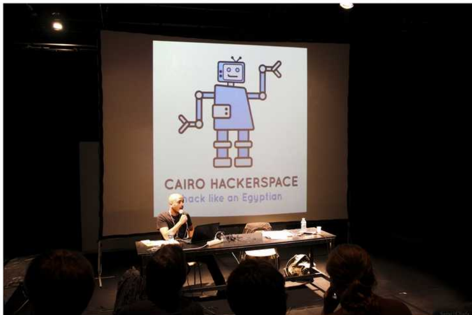
Profil à l'égyptienne

Le festival THSF (pour Toulouse Hacker Space Factory) est issu de la rencontre entre Mix'Art Myrys , le célèbre lieu/collectif Toulousain et Tetalab , un groupe d'honnêtes gens qui ont pour credo le partage de la culture hacker sous sa réelle philosophie. Car oui, 99% des hackers ne sont pas ce stéréotype qui, fier de son asociabilité cachée sous son sweat à capuche, brandit son clavier pour vider ton compte en banque. Non non non, les hackers sont avant tout des curieux, prônant la culture, le partage et les connaissances libres, des explorateurs qui avec leurs tournevis, fers à souder et ordinateurs essaient de comprendre et de changer toute chose pour le meilleur comme le plus inutile. N'as tu jamais voulu démonter ton magnétoscope pour voir comment-que-ça-marche ?